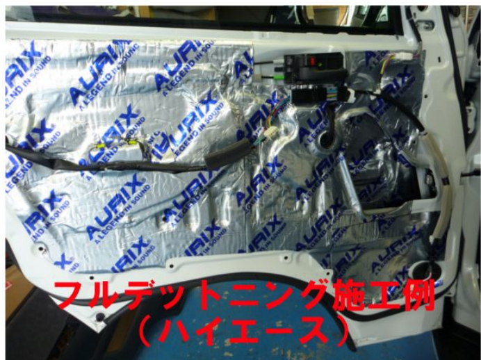
フルデットニング施工例 (ハイエース)